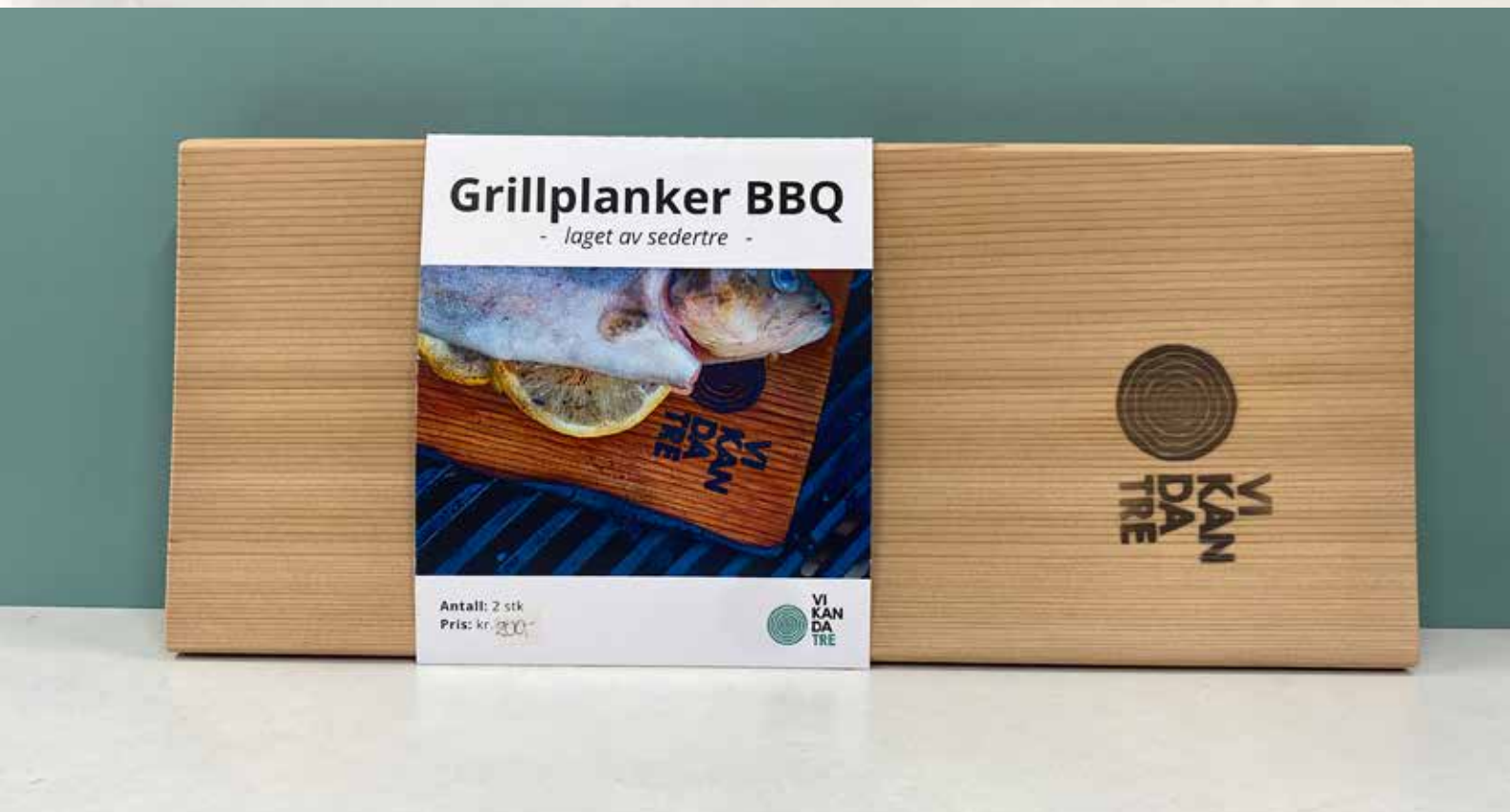
Eksempler på gave- og interiørprodukter fra snekkerverkstedet, for salg i Vikanda Design butikk i Kommunegården, Sandvika.